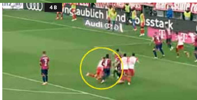
4b_ Kurz bevor der Ball beim Eckstoß ins Spiel gebracht wird, geht der Münchner zu Boden.