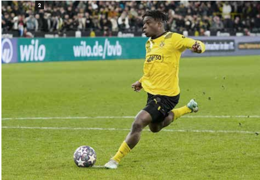
2_Die korrekte Strafstoß-Ausführung ist Thema in Situation 12.